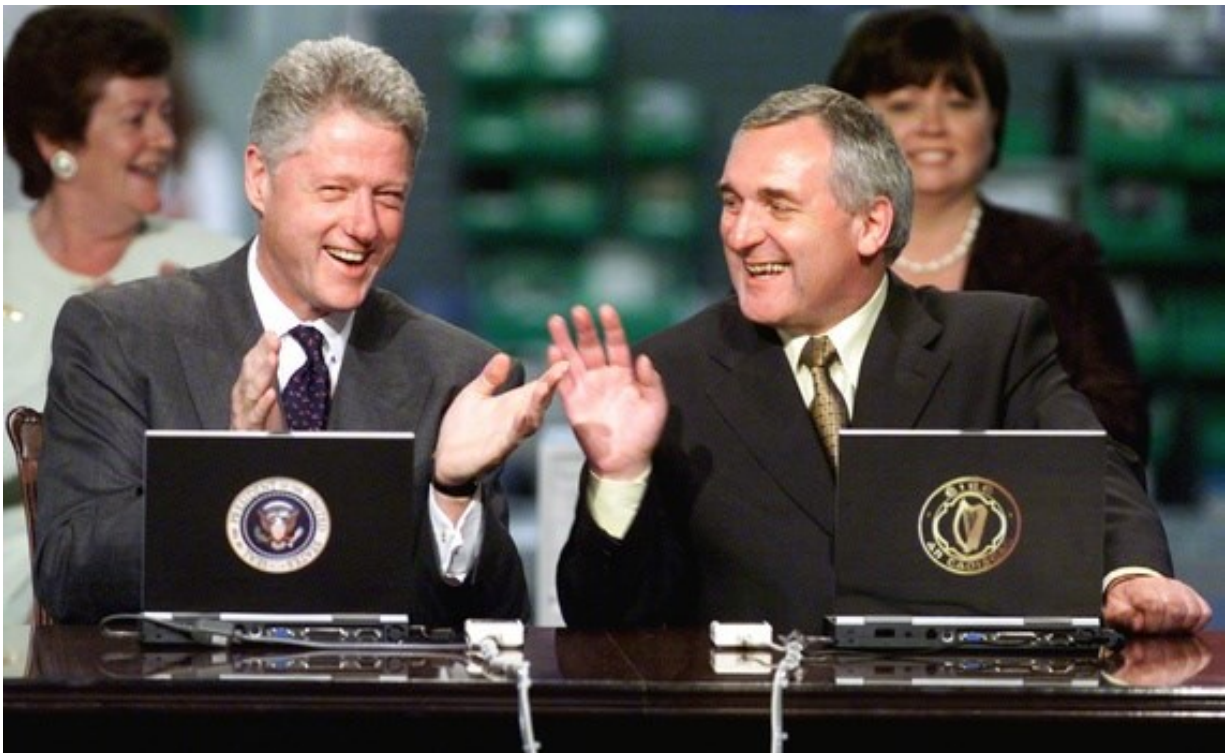
In September the 4 th 1998, U.S. President Bill Clinton and Irish Prime Minister Bertie Ahern became the first heads of government to electronically sign a communique—a pact on e-commerce